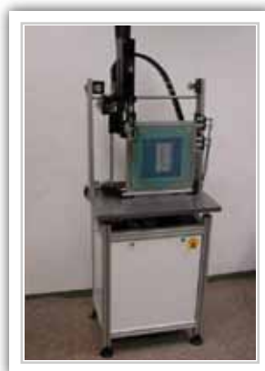
Optischer Inspektionsplatz, montiert