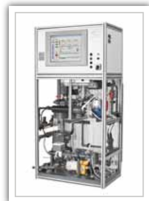
Ferrybox I, montiert